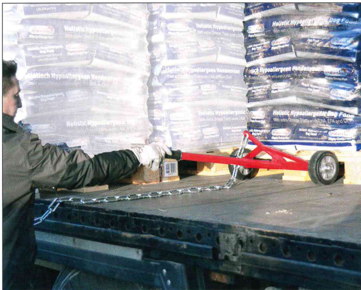
Einsetzen in die Palette