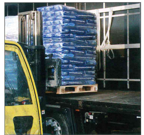
Aufnahme der Palette