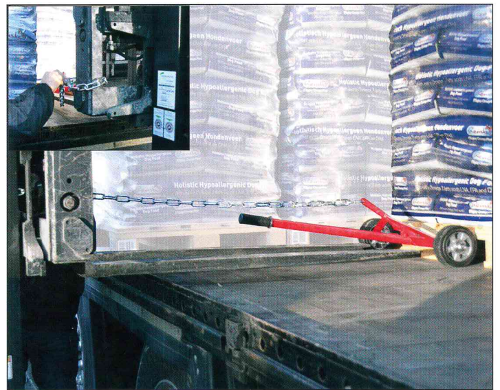
Heranziehen der Palette mittels Gabelstapler in die „Erste Reihe“